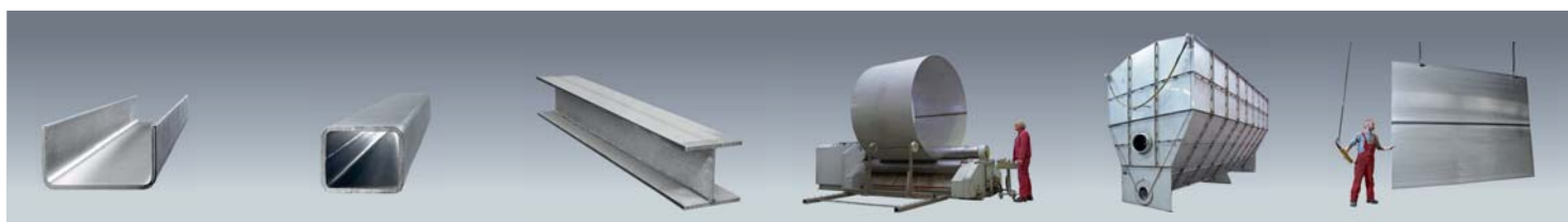
Kantprofile Bent profiles